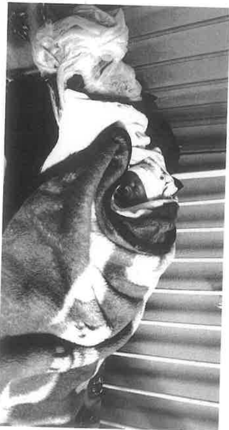
የ 15 ቶናት እድሜ ያለው ህፃን በህፃናት ማሳደጊያ ዉስጥ