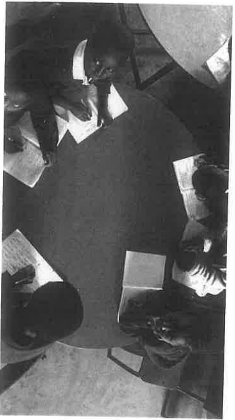
ልጆች በአበበች ጎዘና እንደኛ ደረጃ ትምህርት ቤት ከገደብ ውስጥ