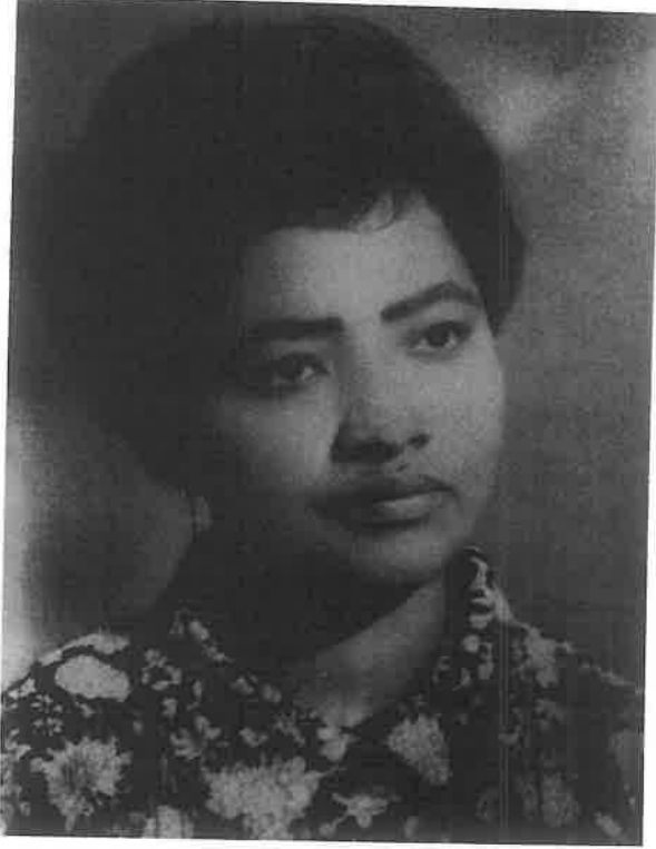
ወ/ሮ አበበች በልጅነታቸው

ወደ ግሽን ማርያም ገዳም የሚወስደውን መንገድ ለማሰራት የገንዘብ ድጋፍ አሰባሳቢ ኮሚቴ ውስጥ ገብቼ፤ ገንዘቡ ከተሰበሰበ በኋላ ወደ ግሽን ለመሄድ ወለንን። አግረ መንገዳችንን ሃይቅ የሚገኘውን የቅዱስ ጊዮርጊስ ቤተክርስቲያን ነብኝተን ስናልፍ፤ በየሜዳው ቁጥር ስፍር የሌለው ሕዝብ ተጋድሞ አየንና ጠጋ ብለን ተመለከትን። መንግሥት ለመደበቅ የሚሞክረው እጅግ የከፋ ረሃብ ተጎጂዎች መሆናቸውን ተገነዘብን። ከቦርሳዬ ውስጥ ዳቦ አውጥቼ ለሁለት ልጆች ልሰጣቸው ስምክር፤ ፖሊሶች ደርሰው “ከዚህ አካባቢ ጥፊ” አሉኝ። “እሞታታለሁ እንጂ ንቅንቅ አልልም” አልኳቸው። እዚያው አጠገቤ ደግሞ አንዲት ጨቅላ፤ መሬቱ ላይ የተጋደመችውን ሴት ጡት ነርሳ ትጠባለች። እናቴ ህይወቷ አልፎ ስለነበር አትንቀሳቀሰም። ወዲያው ሁለመናዬ ተናወጠ። እንደዚያ ዓይነት ሰቆቃ በሀይወቴ ሙሉ አይቼ አላውቅም። ፖሊሶቹ በድጋሚ